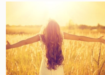
Freundlichkeit mit sich selbst

Selbstmitgefühl kann jeder erlernen - sogar Menschen, die wenig Zuneigung in der Kindheit erfahren haben oder für die es sich unangenehm anfühlt, freundlich zu sich selbst zu sein.